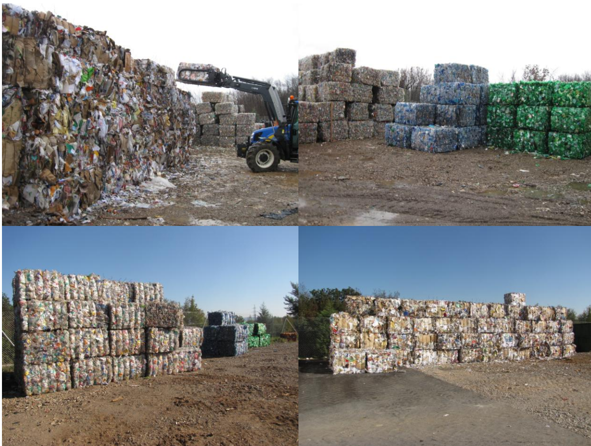
pripravila: Mojca Uršič, KSP d. d. Sežana